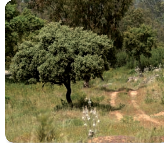
A lo largo del camino podremos observar los resultados de una renovada política forestal dirigida a la recuperación del monte mediterráneo y, por tanto, a la eliminación de especies introducidas de crecimiento rápido.

Cruzamos un pequeño arroyo, sin agua la mayor parte del tiempo, con algunos taludes en sus márgenes en los que podremos observar unos curiosos agujeros, que son nidos de abejarucos. No siempre los veremos revolotear sus llamativos colores, porque se trata de un ave migratoria, que sólo puede alegrarnos la vista en periodo de cría.