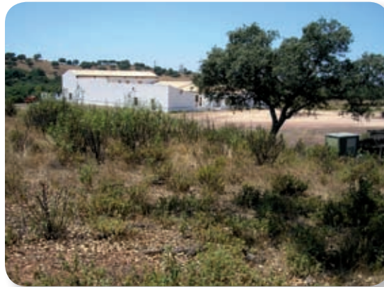
El cortijo El Berrocal, con su centro de visitantes, es el centro de un parque forestal, formado por varias fincas públicas, que se integró en el Parque Natural Sierra Norte de Sevilla en 2004.

Emprendemos la marcha en dirección noreste, subiendo la ladera que tenemos enfrente, cubierta por una dehesa de alcornoques muy dispersos, salpicada de rocas y extensos rodales de jara pringosa. A mitad de ladera pasamos bajo la línea de alta tensión.